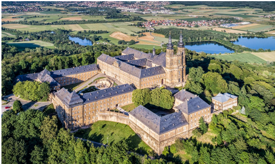
Kloster Banz, Bad Staffelstein