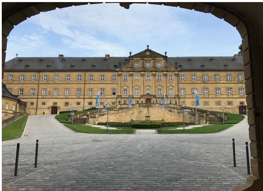
Kloster Banz