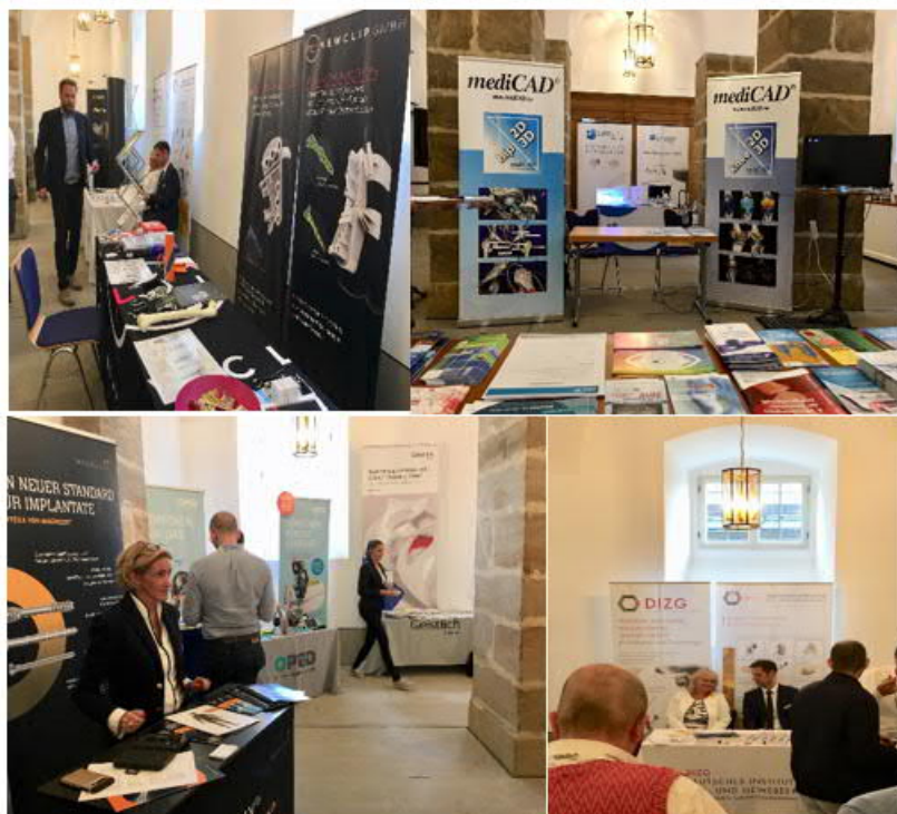
Kurs Kniegelenknahe Osteotomien 2019